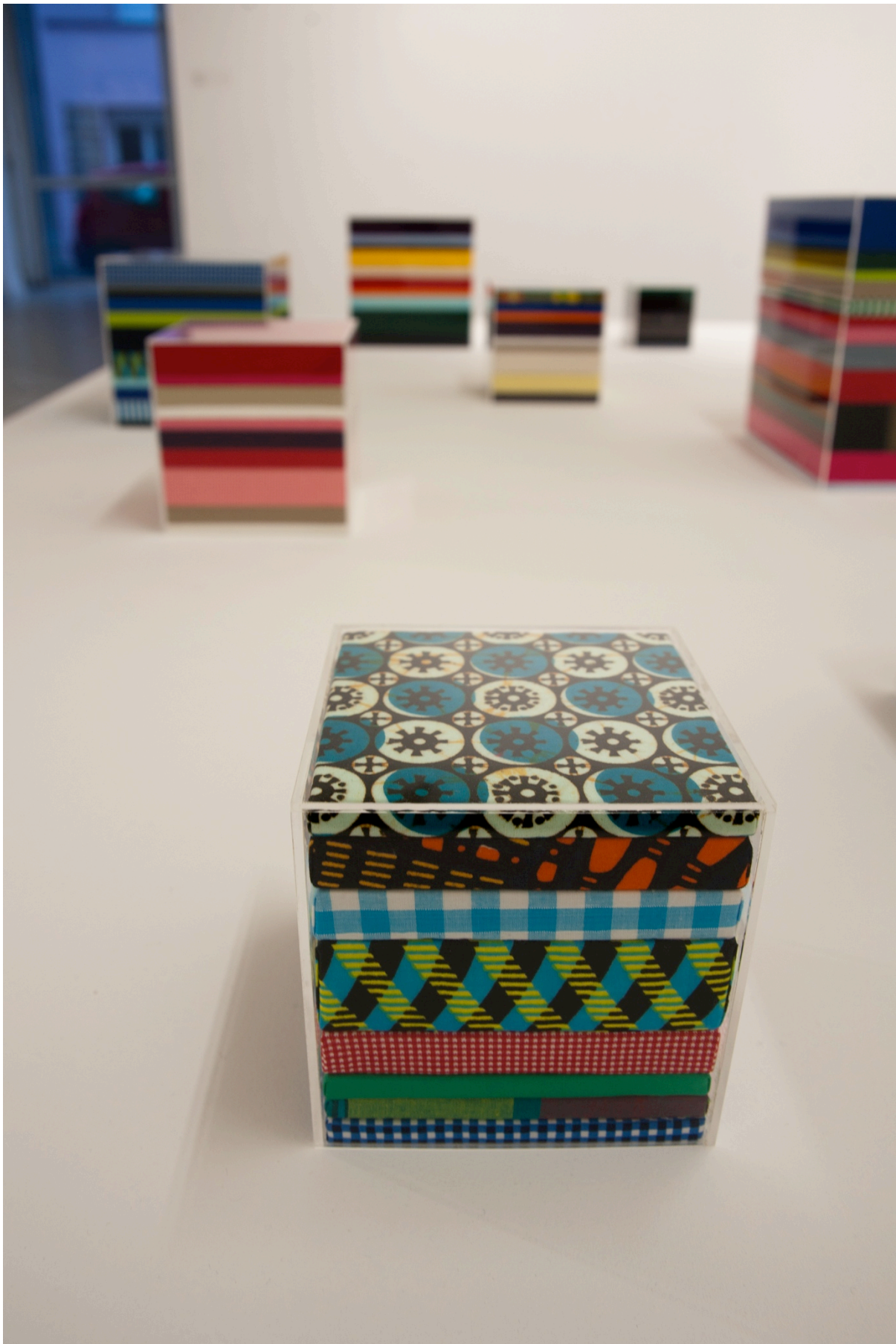
Eva Taulois, Color Slices , 2009 © cac passerelle, Brest - crédits photographiques : N. Ollier, 2012